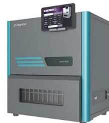
全自动平行浓缩仪 浓缩