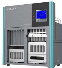
高通量全自动固相萃取仪 净化