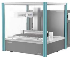
全自动液体样品处理工作站 标液配制

大幅度减少了工作人员的工作量，提高了工作效率。此外还可避免工作人员因操作失误导致的检测偏差，也可将实验人员更迭对检测结果的影响最小化。Auto Prep 200 全自动液体工作站可实现混标、标准曲线的自动配置，全程无需人为值守，让实验人员远离有毒有害的化学物质，保护身体健康。Auto EVA-60 全自动平行浓缩仪处理通量高，60 个样品可同时进行氮吹，实验平行性好，且耗气量小，省时省力。